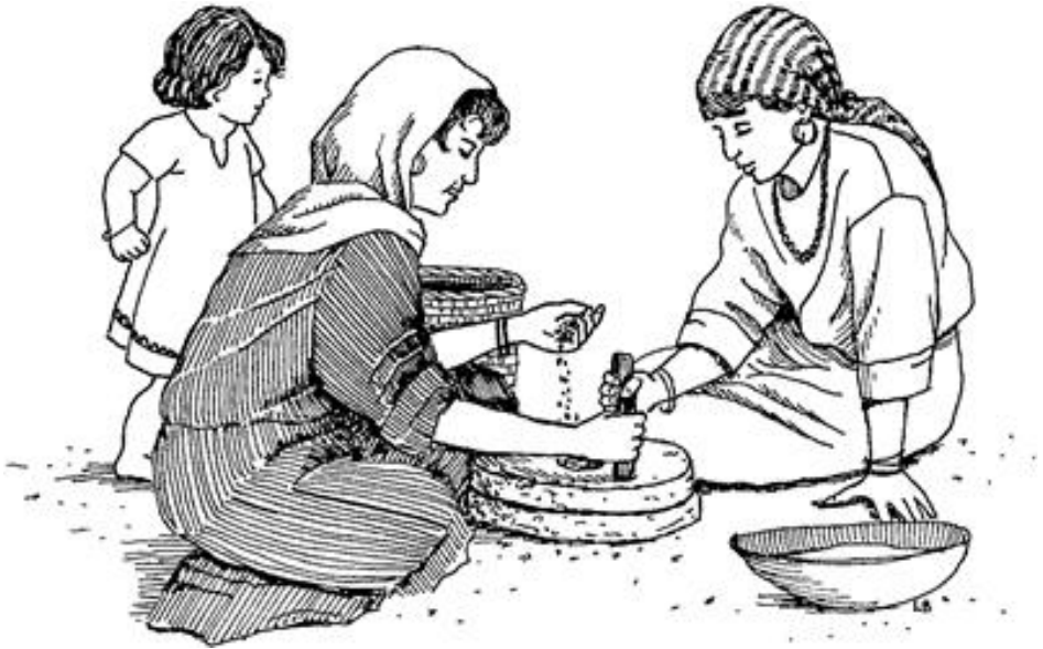
Izirayeli jeele pàa pye na yarilire ti tire tira na (Eki 11.5)

yaara naa warifuwe yaara yenri pe cenyeenle pe yeri.»