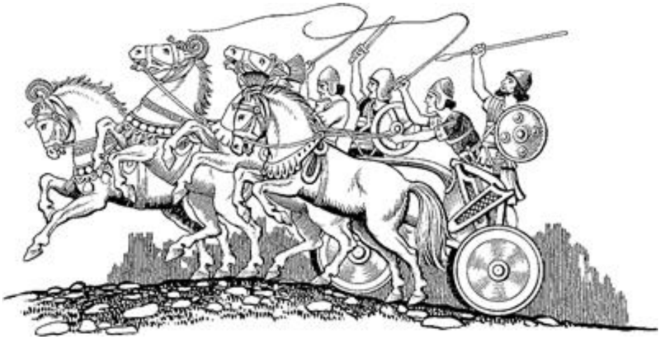
Malaga gbɔnwotoroye mbele shɔnye maa tilele (Eki 14.6)

ti a pɔ̀ malaga gbɔnwotoro wi pɔ̀ shɔn wa na, mɛɛ le ma kari, wo naa wi malingbɔɔnlɔ pe ni. 7 A wì suu malaga gbɔnwotoroye jɛmbele jɛmbele cɛnmɛ kɔ̀gɔ̀lɔni (600) le ma kari, pe ni fuun nungba nungba, malingbɔɔnlɔ taanrindaanri la pye wa pe ni. A Ezhipiti tara malaga gbɔnwotoroye sanmbala pè si taga pe na. 8 A Yawe Yɛnɛle li si Farawɔn wi kotogo ki nɔ̀gban wi na, Ezhipiti tara wunlunaɲa we. A wì si yiri ma taga Izirayeli woolo pe na, na pe puro. Ma sigi ta Izirayeli woolo pàa yiri ma kari pe yɔ̀lɔ̀gɔ̀ ki ni caw. 9 A Ezhipiti tara malingbɔɔnlɔ pe ni fuun, mbele pàa pye shɔn lugufenne, naa mbele pàa pye malaga gbɔnwotoroye pe ni, naa Farawɔn wi shɔnye pe ni, pè si taga Izirayeli woolo pe na, na pe puro, ma saa pe yigi wa Pi Ayirɔ̀ti ca ki tanla, wa Baali Zefɔn laga ki yesinmɛ na, wa kɔ̀gɔ̀je yɔ̀n ki na.