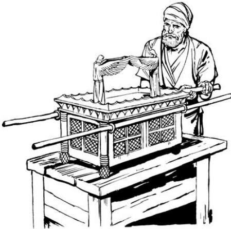
Yenŋele li yɔn finliwe senre kesu (Ɛki 25.10-22)