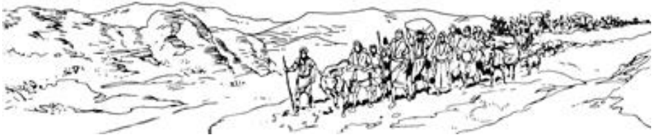
Izirayeli woolo pe yinriwe wa Ezhipiti tara (Eki 12.51)

mbe cen wa ye yeri mbaa ki jaa mbe Paki sherege feti wi pye mi na Yawe Yenjele na mege ni, ki daga poo go woolo nambala pe ni fuun pe kenrekenre. Ko pungo na wi mbe ya mbe Paki feti wi pye paa Izirayeli tara piile pe yen. Lere o lere pe suu kenrekenre wo wa kpe si daga mbe Paki feti yaakara ta ka.» 49 Yoro Izirayeli tara piile naa nambannjeenle mbele pe yen laga ye sogowa, lasiri* konɔ nungba lo ye yaa la tanri li na.»