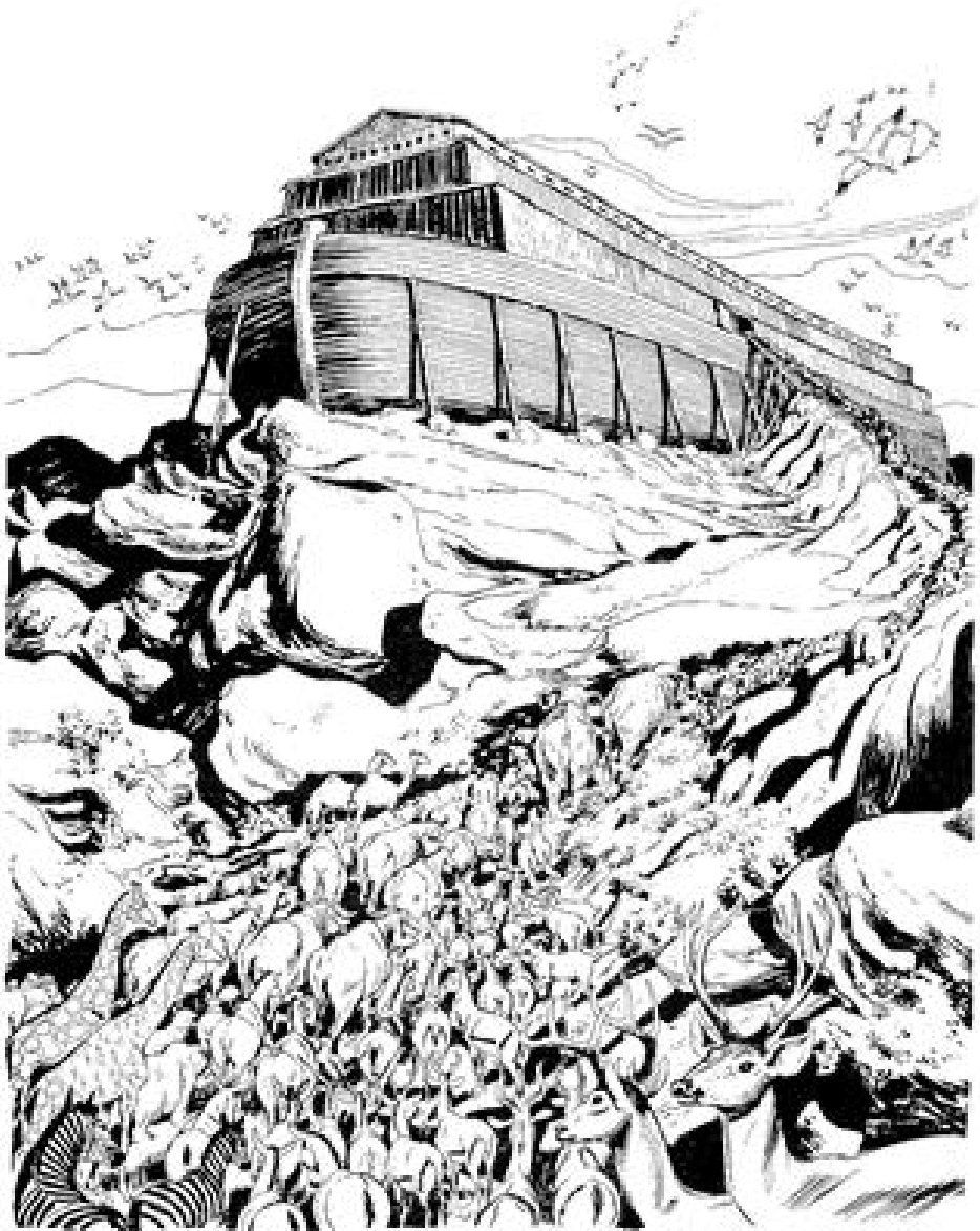
Tɔnmɔkɔrɔ gbɛngɛ nɔga Nowe wila gbɛgele (Zhenɛ 6.14)

panyi ni. 15 Wele, maga gbɛgele ki ma yiri ke (150), ki gbeme pi pye gbɛgewe mba po na: ki titɔnlwɔ pi metere nafa ma yiri kangurugo, pye metere cɛnme naa nafa shyen ki yagawa pi pye metere ke ma