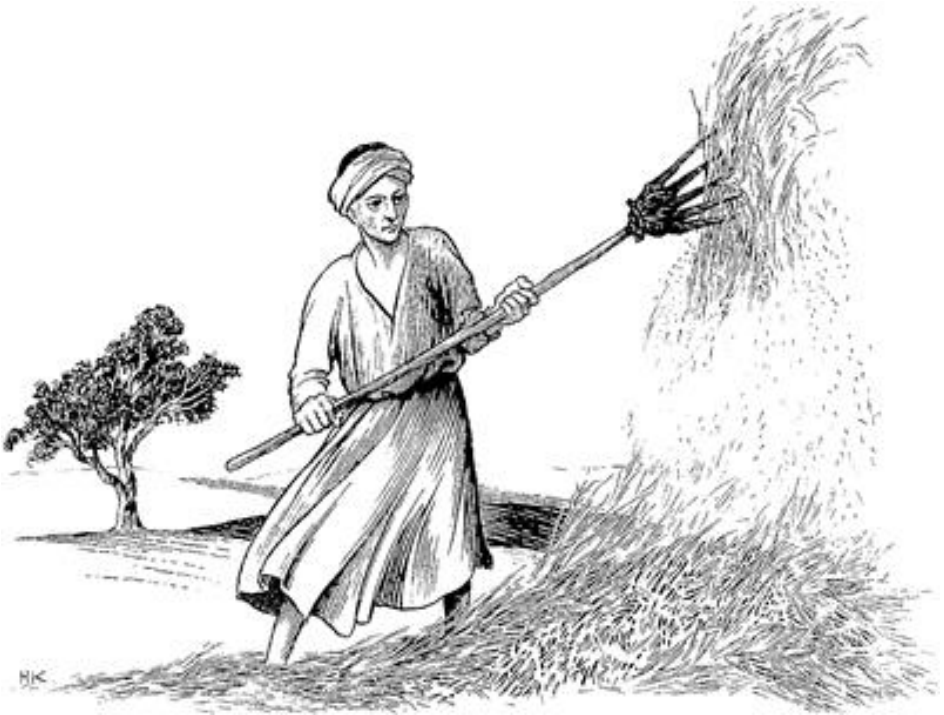
Shɔɔɔɔ ke fɛɛɛ (Mati 3.12)

ni. 12 Wi teli wi yen wi kɛɛ. Wi yaa ka shɔɔɔ ke fɛ mbe ke fooro ti wɔ ti ye jɛnɛɛ wi ni, mbe si jɛnɛɛ wi gbogolo mboo le wa wi bondo wi ni. Eɛn fɔ, wi yaa fooro to sogo wa kasɔn nɔa ki se figi fɔ sanga pyew ko ni.»