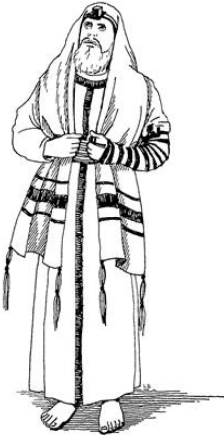
Yaripɔɔ yɔnrɔ naa tafoolo (Mati 23.5)

46 Pe ni, wa sila ya mbe Zhezu wi yɔn sogo senre pyɔ nuɔgba ni. Maga le ko pilige ko na, lere sila soro naa mboo yewe kala la ni.